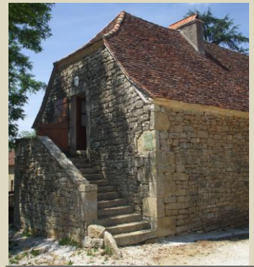
Le bâtiment de l'Association à Salgues Salle « Michel Doumerc »

Nous vous souhaitons à tous une très bonne année 2012 (en pièce jointe ( annexe 1 ) le calendrier des manifestations de 2012 déjà programmées)