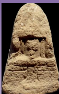
Statuette du Puy d'Issolud