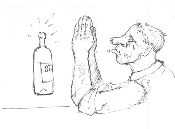
Illustration : Walter Dolphyn

Le vin , sd. André Dominé, Editions Place des Victoires, 1 ère édition 2001. Le pavé ! Au sens propre. Son poids (3,8 kg environ) le rend difficilement transportable dans un chai ou chez un caviste. Au sens figuré, une somme réalisée par une équipe de spécialistes. Le vignoble français a droit à 180 pages, celui d'Italie à 112 pages, celui d'Espagne à 74 pages etc. Tous les recoins sont visités (Inde, la Chine et le Japon ne sont pas oubliés). Au total, un tour du monde en plus de neuf cents pages.