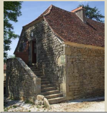
Le bâtiment de l'Association à Salgues Salle « Michel Doumerc »