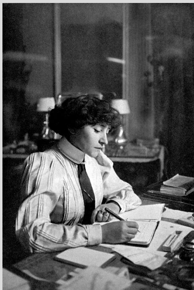
Colette (1873-1954) – suite et fin

Il est extrêmement difficile et frustrant de choisir parmi les écrits de Colette quand on les aime tous. Pourtant, on se ravise en se rappelant ce qu'elle avait « osé » dire : « Non, je ne voulais pas écrire. Quand on peut pénétrer dans le royaume enchanté de la lecture, pourquoi écrire ? ». Connaissant son sens de l'humour, je lui aurais répondu du tac au tac : « Mais pour nous donner le bonheur de "pénétrer dans le royaume enchanté "de Madame Colette ! ».